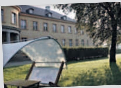
Vor dem Industrieparkzentrum Premnitz steht diese Sitzlounge zum Testen. Bewährt sie sich, gibt es das Modell auch auf der BUGA.