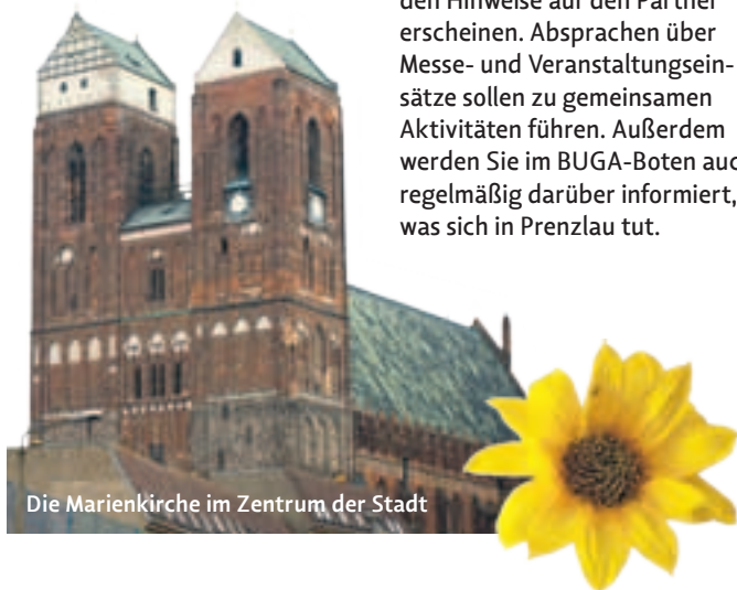
Die Marienkirche im Zentrum der Stadt

2013 regelmäßig auf der Laga präsent sein, um die Besucher für die „große“ Gartenschau 2015 zu begeistern. Auch auf Flyern und in Broschüren werden Hinweise auf den Partner erscheinen. Absprachen über Messe- und Veranstaltungseinsätze sollen zu gemeinsamen Aktivitäten führen. Außerdem werden Sie im BUGA-Boten auch regelmäßig darüber informiert, was sich in Prenzlau tut.