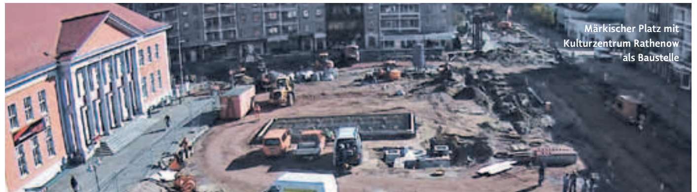
Märkischer Platz mit Kulturzentrum Rathenow als Baustelle

Mehr Infos in den kostenlosen Broschüren, die über die Tourismusverbände Havelland und Altmark zu beziehen sind.