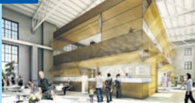
Entwurfsskizze: Das zukünftige Eingangstor des Ausstellungsgeländes