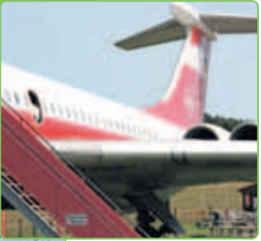
Rhinow hat ein nicht ganz alltägliches Standesamt: die IL 62 „Lady Agnes“ (oben).

NEU Infrastruktur: Ein Fußweg wird vom Museum im Lilienthal-Centrum zum neu entstehenden Fliegerpark führen. Der Plan für den Parkplatz wurde befürwortet. Für die Anbindung des Radweges von der Landesgrenze Sachsen-Anhalt bis nach Rhinow wurden die Förderanträge gestellt.