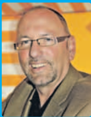
Liebe Bürgerinnen und Bürger der Havelregion,

nur noch etwas über drei Jahre trennen uns von der Eröffnung unserer BUGA, der Bundesgartenschau der Havelregion. Dann präsentieren die Städte Brandenburg an der Havel, Premnitz, Rathenow, die Hansestadt Havelberg und das Amt Rhinow eine noch nie dagewesene BUGA. Gäste von Nah und Fern werden in der Havelregion eine Gartenschau erleben, die es so in deren 60-jähriger Geschichte noch nie gegeben hat.